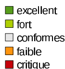
Fig. 3.1 – Légende de couleur du classement par critère (tableau 3.3)

Le tableau 3.3 présente le classement privilégiant le nombre de critères d'évaluation notés positivement. Le nom et le rang de l'université sont donnés, suivi d'une représentation graphique de la répartition des notes des 27 critères d'évaluation en critères excellents, forts, conformes, faibles ou critiques. La figure 3.1 précise la légende de couleur associée.